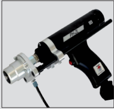
Standardschweißpistole PH-2 PH-2 standard welding gun