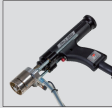
Schweißpistole PH-3N SRM 16 zum Mutter- und Bolzenschweißen mit magnetisch bewegtem Lichtbogen PH-3N SRM 16 welding gun for nut and stud welding using a magnetically moved arc

* P01341 = BMK-16i Automatik * P01041 = BMK-16i automatic